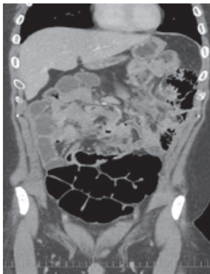
Obr. 3. CT vyšetření břicha 2023.

Fig. 3. CT scan of the abdomen 2023.