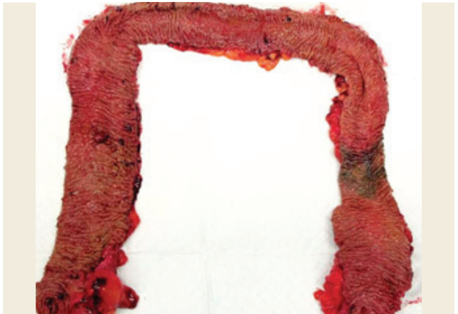
Obr. 2. Resekát tlustého střeva s mnohočetnými adenomy. (Zdroj: prof. MUDr. Mojmir Kasalický, Ph.D., Chirurgická klinika 2. LF UK a ÚVN – VFN Praha).

Fig. 1. Magnetic resonance imaging in 2021. (Source: Adam Pavlíčko, MD, Clinical Centre ISCARE a.s.).