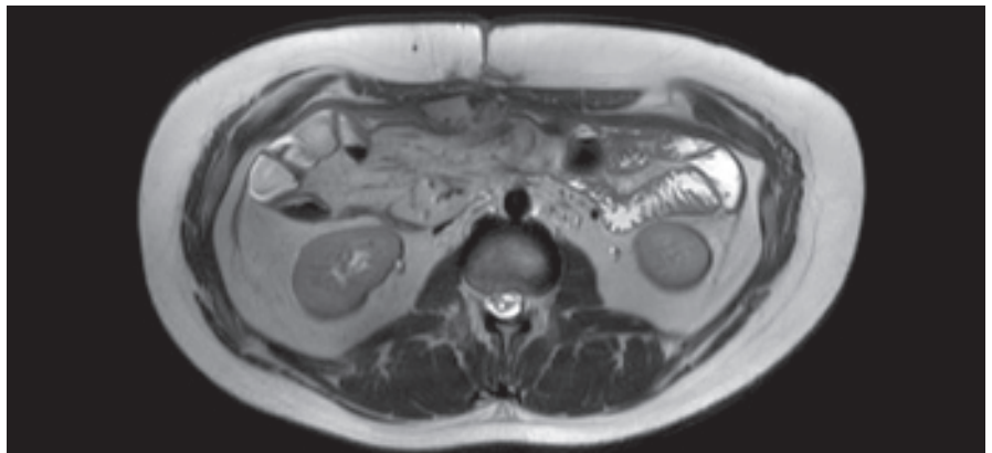
Obr. 1. Magnetická rezonance v roce 2021.

Fig. 1. Magnetic resonance imaging in 2021.